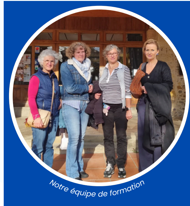
Notre équipe de formation

Les formations détaillées sont disponibles ici