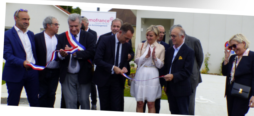
Le Président de la Communauté des Communes, le Directeur Domofrance, le Préfet et la sous-préfète.

Le Préfet, lui, a conclu avec conviction : « À Malaussanne, on construit plus que des logements : on construit un projet de société ».